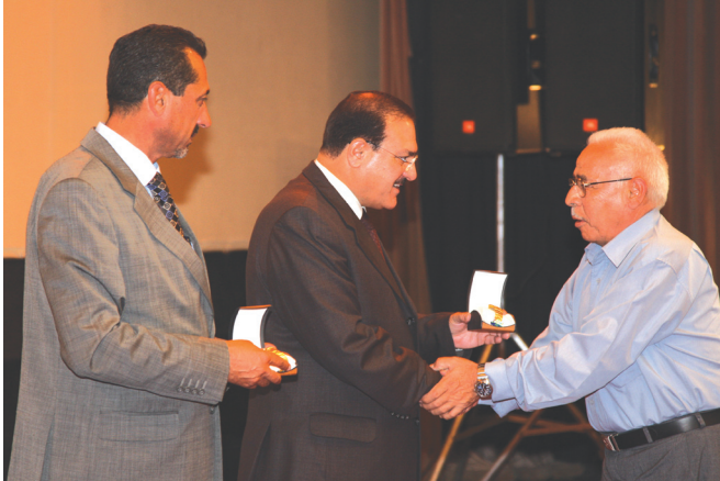
تكريم المحالين على التقاعد

وسلم الدكتور الطويسى الهدايا التقديرية للمكرمين وتمنى لهم التوفيق والنجاح في حياتهم المستقبلية.