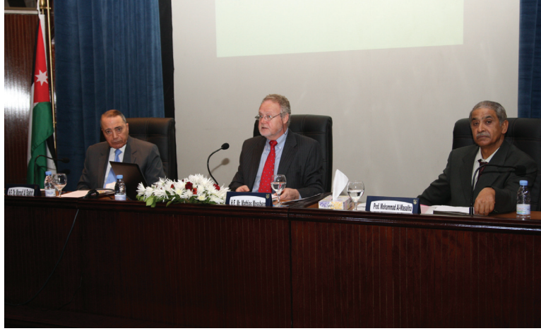
جانب من المحاضرة

بدوره أكد العين البخيت المواقف الأردنية الثابتة والداعمة لحل النزاع الفلسطيني الإسرائيلي بما يضمن الحقوق المشروعة للشعب الفلسطيني من خلال إقامة دولته على التراب الفلسطيني.