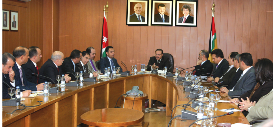
رئيس الجامعة ملتقياً بمدراء دوائر الجامعة

الجامعة- شدد رئيس الجامعة الدكتور عادل الطويسي على ضرورة وقف «النزيف» الحاصل في الكفاءات الأكاديمية والإدارية. وركز الدكتور الطويسي خلال لقائه مدراء التتمة... ص ١٠