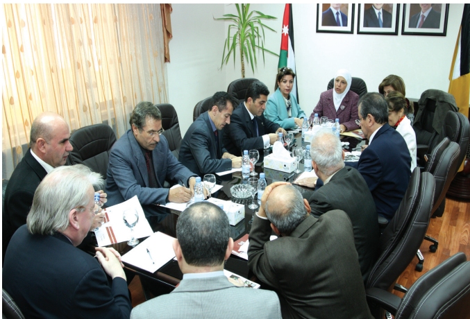
الدكتورة الخيمي والوفد الضيف

العلمية مع جامعات عالمية متقدمة. ورحب بقبول طلبة أردنيين لإكمال دراستهم الجامعية العليا خصوصاً في تخصصات الأعمال وتكنولوجيا المعلومات وغيرها من التخصصات العلمية التطبيقية والإنسانية.