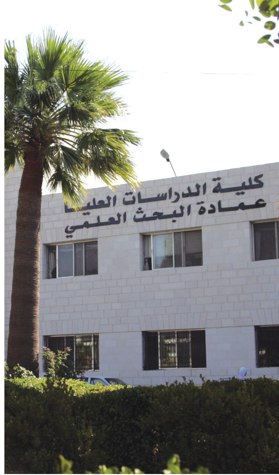
مبنى عمادة البحث العلمي

ويتولى المعهد عقد دورات فصلية منتظمة في نظام الكتابة العربية والتواصل باللغة العربية في الحياة اليومية للطلبة الراغبين ممن لغتهم الأم غير العربية بمن فيهم الطلبة العرب الذين لا يتكلمون العربية ويدرسون بغير العربية.