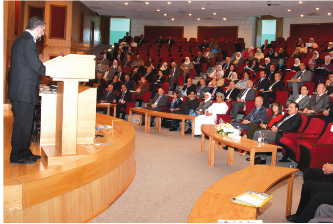
جانب من المؤتمر

لأهمية البحث العلمي في الميادين الإنسانية والعلمية والصحية. وتضمن المؤتمر عرض ومناقشة ٨٨ بحثاً وشملت محاوره أحدث البحوث في مجالات الآداب والعلوم الإنسانية والاجتماعية والعلوم المالية والإدارية والاقتصادية والعلوم التربوية والتربية الرياضية والفنية والعلوم القانونية والشرعية والدراسات الإسلامية والمقارنة والعلوم الأساسية