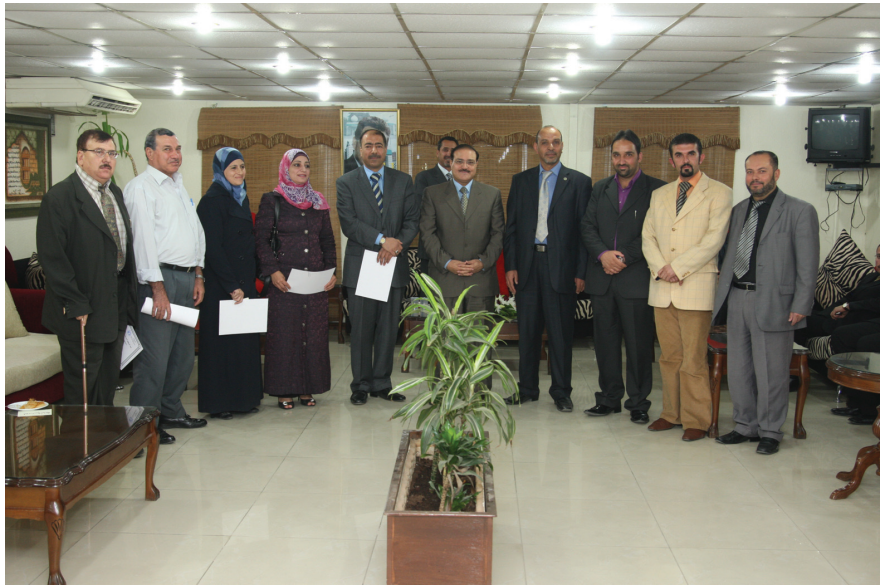
صورة تذكارية للمشاركة

الجامعة - كرم رئيس الجامعة الدكتور عادل الطويسى الفائزين في المسابقة الثقافية التي نظمها نادي الجامعة. وخلال الحفل التكريمي الذي أقيم بهذه المناسبة أكد الدكتور الطويسى أهمية هذه المسابقات الثقافية في دعم التواصل الاجتماعي والحراك الثقافي بين أعضاء أسرة الجامعة. وأشار إلى أن هذه النشاطات تسهم أيضاً في تنمية البحث عن المعلومة والتنافس بين العاملين في الجامعة خارج إطار العمل معرباً عن تقديره للهيئة الإدارية للنادي على تنظيم نشاطات متنوعة مما يدل على صدق الانتماء لهذه المؤسسة التعليمية. بدوره أشار رئيس النادي صالح أبو هزيم إلى أهداف المسابقة الرامية لتنشيط المكون الثقافي بين أعضاء الأسرة الجامعية وإتاحة الفرص لإظهار الطاقات الإبداعية